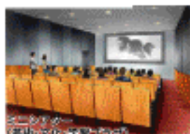
芸術・文化・学習プラザ