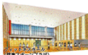
健康スポーツプラザ