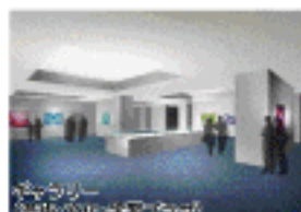
芸術・文化・学習プラザ